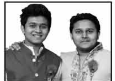
ધરિન - દૈનિક